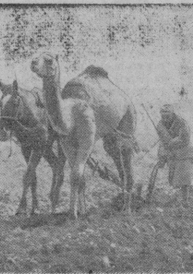
Un agricultor argelino arando su predio con un dromedario y un caballo.