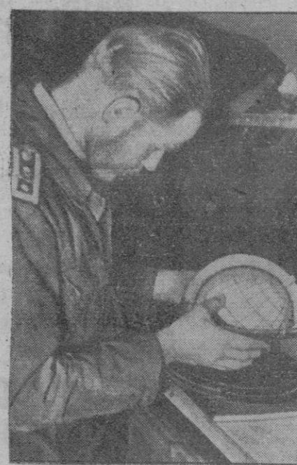
Timonel de un submarino alemán orientándose sobre la situación del mismo.

La guerra en el mar no cede en importancia a la guerra terrestre. Se ha llegado a decir que la lucha contra la navegación será la que en definitiva decida la contienda por la razón de que todos los frentes aliados han de ser abastecidos por vía marítima, y es un hecho cierto que los anglosajones no disponen del tonelaje necesario para atender a sus enormes necesidades.