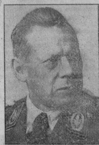
Huhnlein, jefe del Cuerpo motorizado nacional-socialista, muerto en Berlín víctima de una enfermedad

Munich, 10 (2 t.).—Riccardi, ministro de Comercio italiano, que se encuentra actualmente en Alemania, como huésped del Gobierno del Reich, ha llegado a Munich esta mañana, procedente de Berlín. Luego de ser recibido en la estación central por los ministros del Reich, Funk y Rust, el secretario de Estado, Hermann, Esser, y el primer ministro de Baviera, Siefert, Riccardi fue introducido en el salón de los Príncipes, donde fue recibido cordialmente por el gauléiter Giesler, quien le expresó la bienvenida, no sólo como ministro italiano, sino también como combatiente del fascismo. Seguidamente el ministro italiano, acompañado de sus colegas alemanes, Funk y Rust, rindió homenaje a los muertos del partido nacional-socialista, depositando una corona en el monumento a los mismos. Riccardi ha sido nombrado doctor honoris causa de la Universidad de Munich.