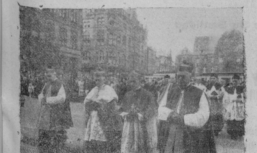
LA VIDA CATORICA EN ALEMANIA.—El 21 de Junio ha sido entronizado el nuevo arzobispo de Colonia, doctor Frings. He aquí la procesión después de la ceremonia religiosa, dirigiéndose al palacio del nuevo arzobispo. El doctor Frings es el segundo de la derecha

Vichy, 10 (2 t.).—A las diez treinta de esta mañana se ha reunido el Consejo de ministros bajo la presidencia del mariscal Pétain, en el pabellón Sevigne.—Efe.