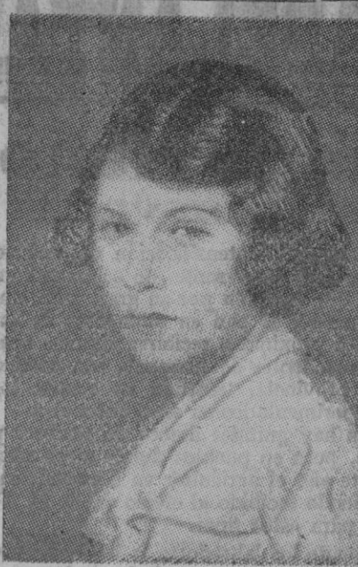
LA PRINCESA ELIZABETH, heredera del Trono de Inglaterra, que acaba de cumplir dieciséis años. Según la nueva Ley sobre reclutamiento, la princesa Elizabeth ha sido inscrita para prestar sus servicios en una organización juvenil.

Roma, 15 (5 t.).—Una mujer de cuarenta y cinco años, casada con un empleado de ferrocarriles, de sesenta y tres, acaba de dar a luz a su veinticuatro hijo, según informan los periódicos.