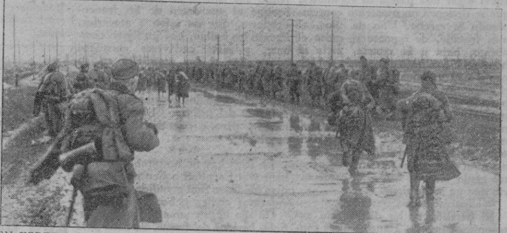
EN ESPERA DE MEJOR TIEMPO.—Por las carreteras encharcadas de Rusia camina ahora la infantería alemana, concentrándose en los lugares elegidos, desde los cuales partirán los futuros ataques.

En África del Norte, se han registrado duelos de artillería y actividad de reconocimiento en ambos campos. La aviación alemana ha bombardeado, con éxito, en el curso de ataques nocturnos, el ferrocarril del Desierto británico y concentraciones de camiones. Nuestros bombarderos han alcanzado con sus proyectiles en diferentes ocasiones, los aeródromos, depósitos de torpedos y de esencia de la isla de Malta. Durante el día los bombarderos alemanes han atacado los objetivos de importancia militar de la costa Sur y Sureste de Inglaterra y han hundido a un barco-patrulla al Suroeste de Worthing. Como represalia por los ataques británicos contra las ciudades y villas alemanas, nuestras formaciones de bombardeo atacaron anoche la ciudad de Norwich, realizándose parte de la