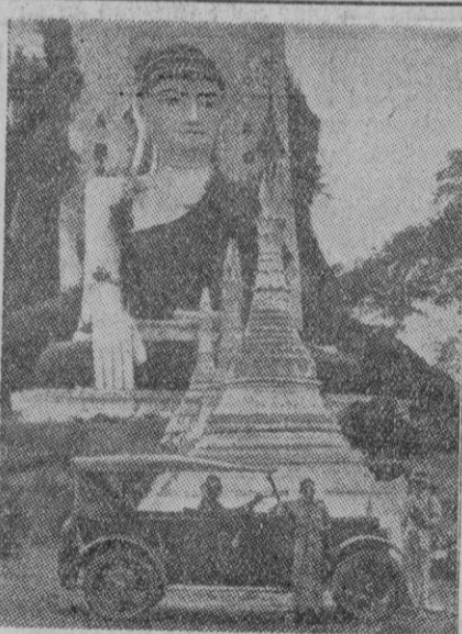
Pogú, la ciudad birmana ocupada recientemente por los japoneses, cuenta con numerosas estatuas budistas, siendo la más célebre la del "Buda durmiente". El grabado reproduce una de dichas estatuas