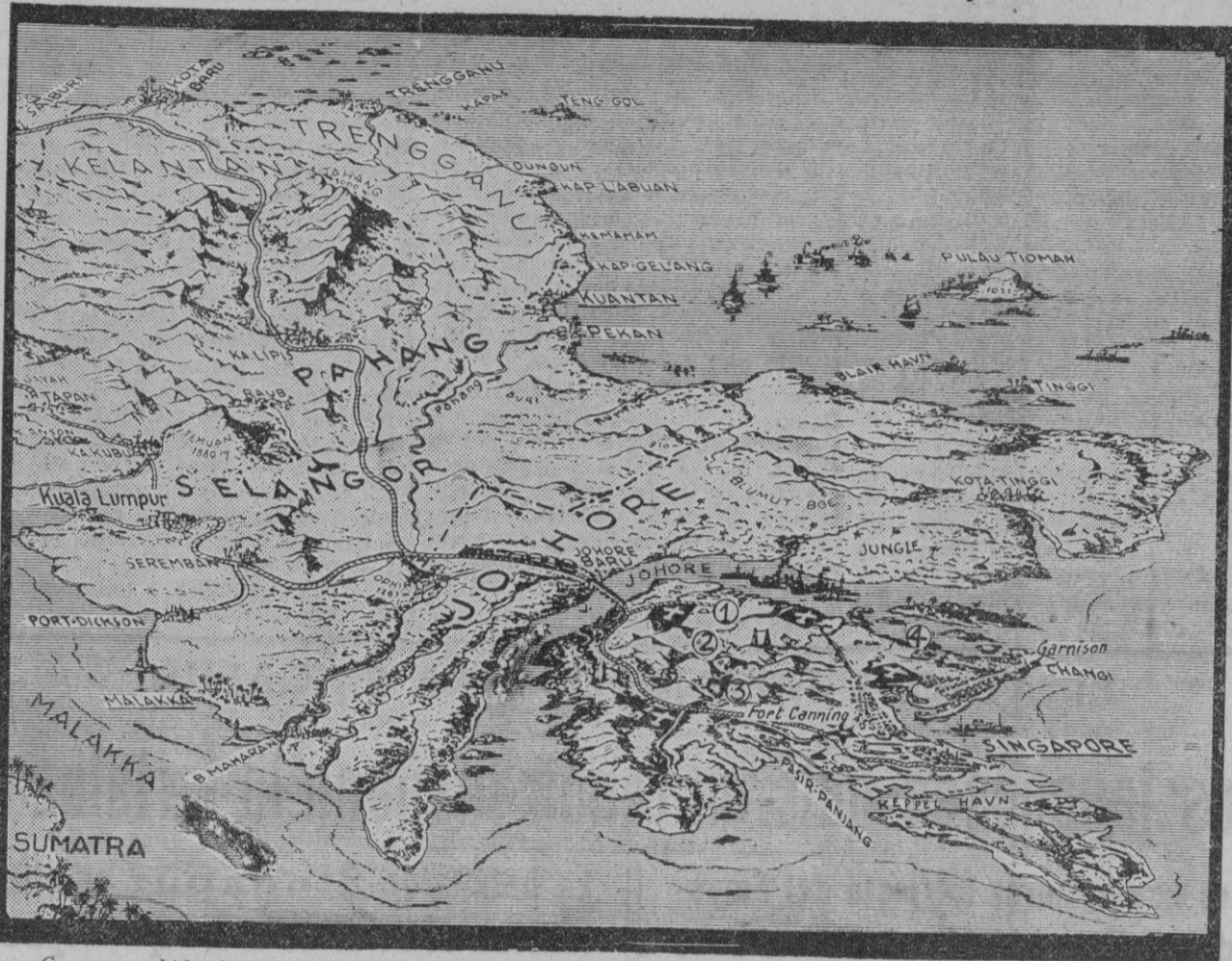
Como es sabido, la isla de Singapur, con sus 562 kilómetros cuadrados de superficie, es una de las fortalezas mayores del mundo. Cuenta con una población de seiscientos mil habitantes.

Tokio, 10 (2 t.)—Las tropas japonesas desembarcadas al Este del dique de Singapur, han penetrado en la parte Sur de la región, después de romper las líneas de blocaos británicos.—Efe.