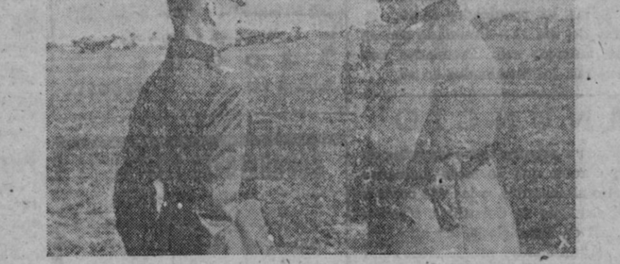
ARTIFICES DE LA VICTORIA SOBRE EL COMUNISMO.—El mariscal Keitel, jefe del alto mando del Ejército alemán, conversa en el frente con el mariscal von Rundstedt, comandante en jefe de los ejércitos alemanes y aliados que con tanto éxito vienen operando en Ucrania

Las fuerzas aéreas italo-alemanas han proseguido en Africa septentrional la obra de destrucción de objetivos enemigos de Tobruk y Marsa Matruh, y han bombardeado un aeródromo en el desierto egipcio. Actividad de nuestra artillería en los sectores de Sollum y Tobruk. Los aviones británicos han lanzado bombas sobre Benghazi. Los barrios habitados por la población árabe han resultado afectados. Otro incursión enemiga sobre Catania no ha ocasionado víctimas ni destrozos. En Africa