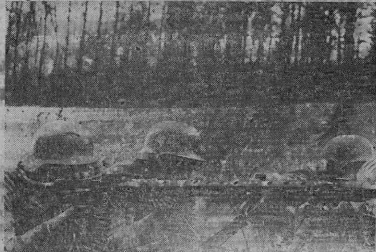
EN EL FRENTE DEL ESTE.—Mientras las ametralladoras distraen la atención del enemigo, los grupos de asalto se preparan para tomar las posiciones rojas

Roma, 12 (5 t.)—Comunicado del cuartel general de las fuerzas italianas: Las bases aéreas y navales enemigas de la isla de Malta han sido eficazmente bombardeadas la pasada noche por formaciones de aviones italianos. Otros aviones de la Aeronáutica Real, han atacado las refinadoras de petróleo de Haifa, donde provocaron numerosos incendios, así como un aeródromo de la isla de Chipre.