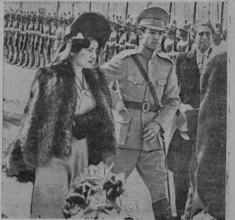
Fotografía del Príncipe heredero del Irán y de su esposa la Princesa Fawzia, hermana del Rey de Egipto, después de haber contraído matrimonio en Teherán

El Gobierno del Irán aseguró a los Gobiernos demandantes que vigilaría todos los movimientos de los extranjeros que se encuentran en el país, y que el pequeño número de alemanes en el residente no ofrecía el menor peligro. Con objeto de tranquilizar a la Gran Bretaña y la U. R. S. S., el Gobierno iraní adoptó medidas especiales para reducir el número de alemanes, e hizo cuanto estuvo en su mano para dar satisfacción a los