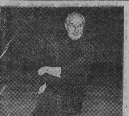
Sir Samuel Hoare, el nuevo ministro inglés del Aire, es un artista consumado del patin. Aquí le vemos patinando con una agilidad impropia de su edad

Londres, 15 (5 t).—Un convoy de transportes, enemigo, ha sido atacado en Skagerrak por submarinos ingleses, como precedentemente se había anunciado. Cuatro torpedos alcanzaron su objetivo.