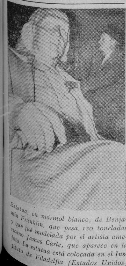
Estadua, en mármol blanco, de Benjamin Franklin, que pesa 120 toneladas y que fue modelada por el artista americano James Carle, que aparece en la foto. La estatua está colocada en el Instituto de Filadelfia (Estados Unidos)

Londres, 21.—En el ministerio de Información anuncian que se han introducido algunos cambios en la lista de productos cuya exportación está prohibida.—Efe.