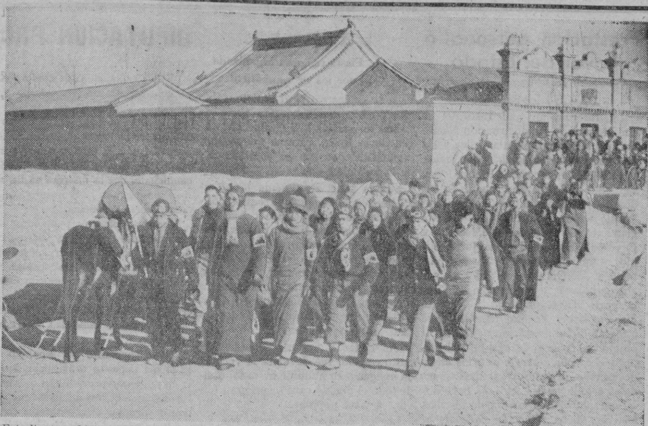
Estudiantes chinos protestando contra la invasión reciente de los japoneses en su país. Sin duda alguna, este grupo de escolares es partidario del Gobierno de Chan Kai Shek, porque la mayor parte del antiguo Imperio chino ha reconocido la influencia civilizadora y progresiva en el del Japón...