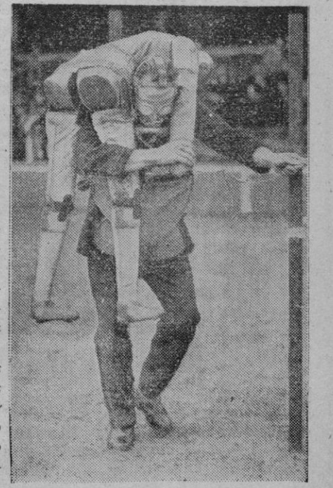
He aquí un bombero inglés, provisto de una careta antigás, en unos ejercicios de salvamento, llevando a hombros a un supuesto herido en un bombardeo aéreo

Apelo a la razón de los hombres para impedir la modificación de la Ley y espero que prevalecerá el buen sentido.—Efe.