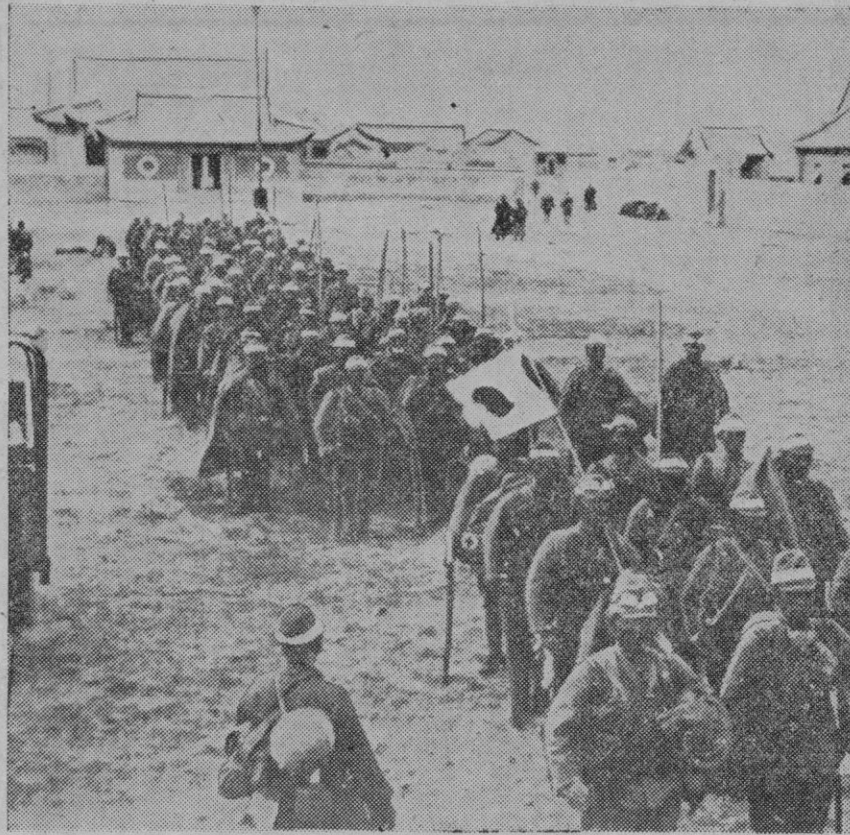
División de tropas japonesas dirigiéndose a la frontera de Mongolia y Manchukuo para reforzar los efectivos que combaten contra los soldados mongol-soviéticos