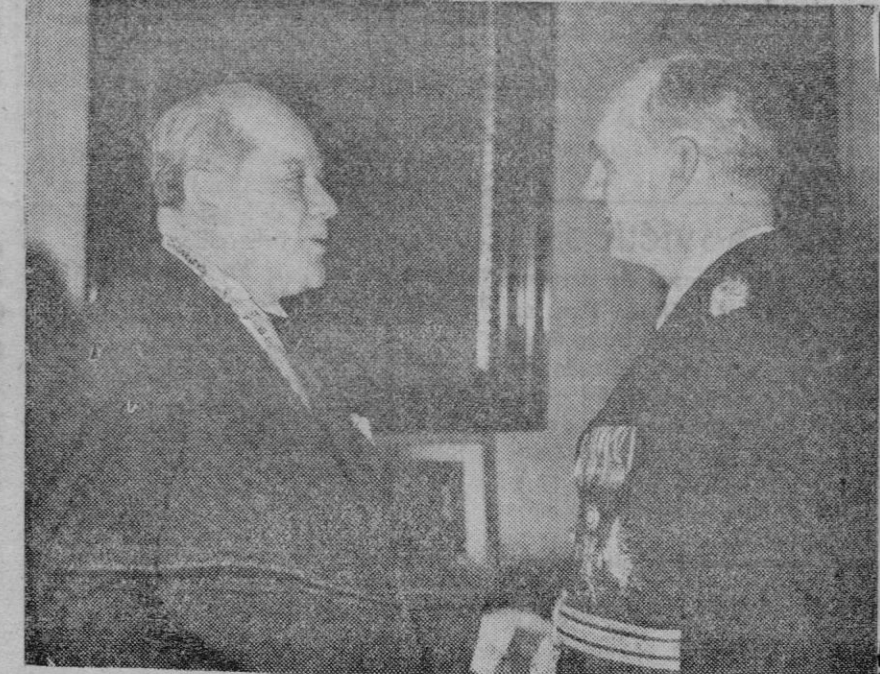
Rissievahor (a la izquierda), primer ministro de Bulgaria, fotografiado con el ministro de Negocios Extranjeros de Alemania, von Ribbentrop. Como es sabido, a la visita del jefe búlgaro se le concedió gran importancia por lo que representa de acercamiento de Bulgaria a Alemania