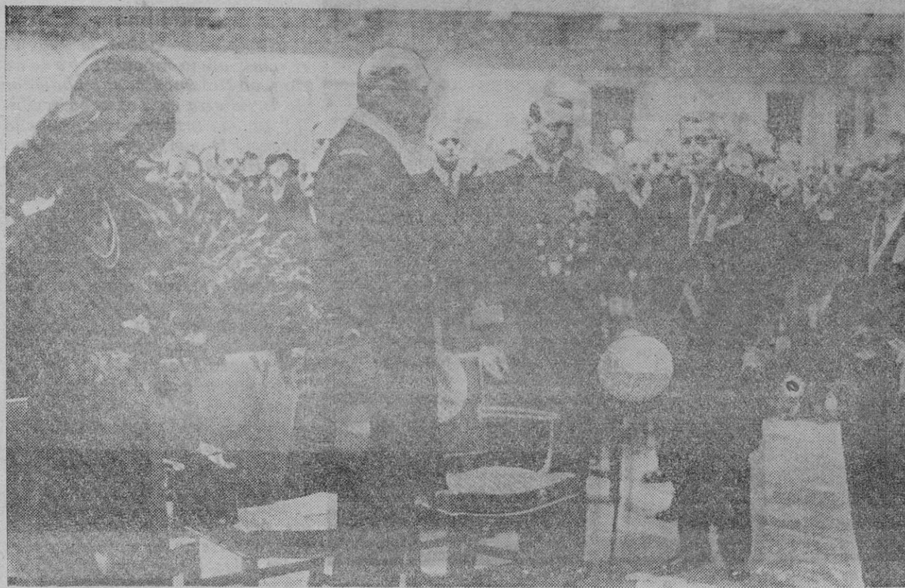
EL CONGRESO DE LA CAMARA INTERNACIONAL DE COMERCIO.—En Copenhague acaba de celebrarse un Congreso de Comercio Internacional, con participación de unos doscientos representantes de cuarenta naciones.