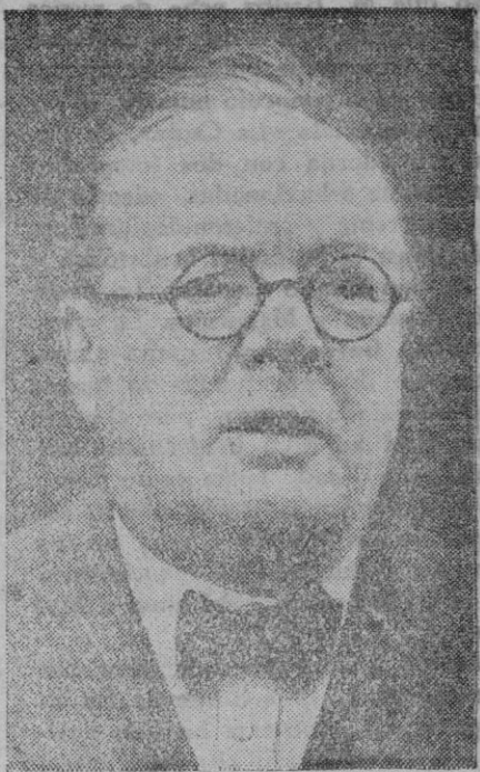
Winston Churchill, el más venenoso de los agitadores ingleses en favor de la guerra, y al cual se indica como probable ministro de Marina si se realiza la reforma del Gabinete que se había anunciado para el otoño