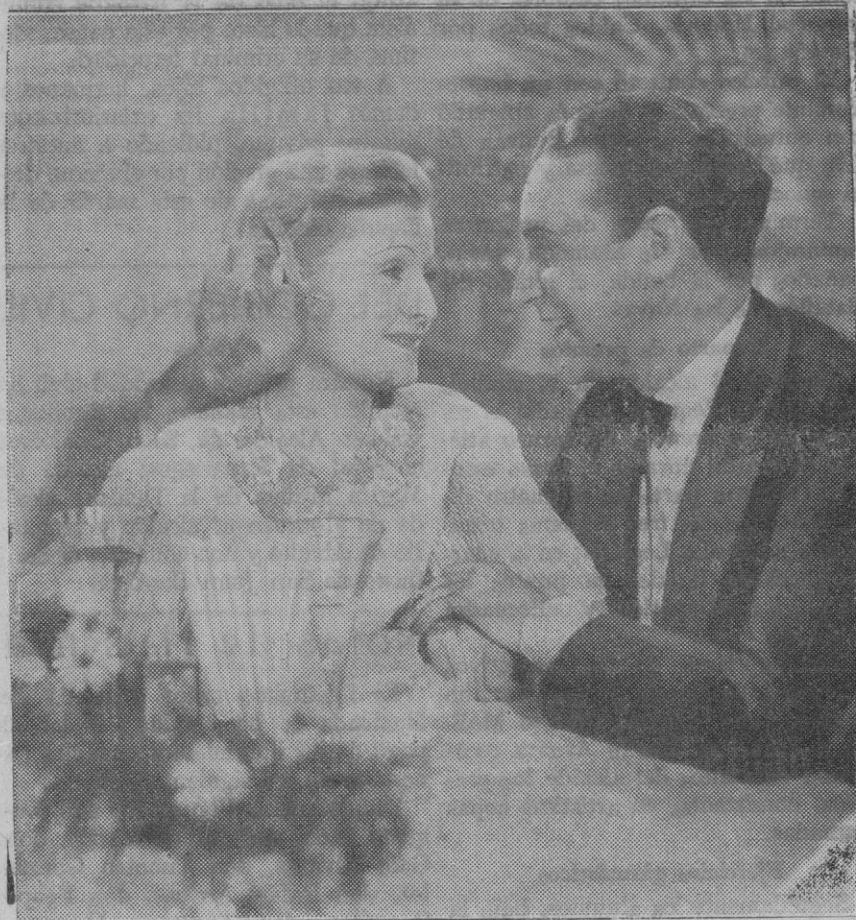
La genial estrella cinematográfica Luan Harvey y Willy Fritsch, en una escena de la nueva película Ufa, "La mujer al volante"

Londres, 20.—El Gobierno inglés ha enviado al embajador británico en Moscú nuevas instrucciones para que se continúen las negociaciones con Molotov. Existe la impresión de que los acontecimientos en Extremo Oriente harán cambiar el modo de pensar del Kremlin.—D. R. V.