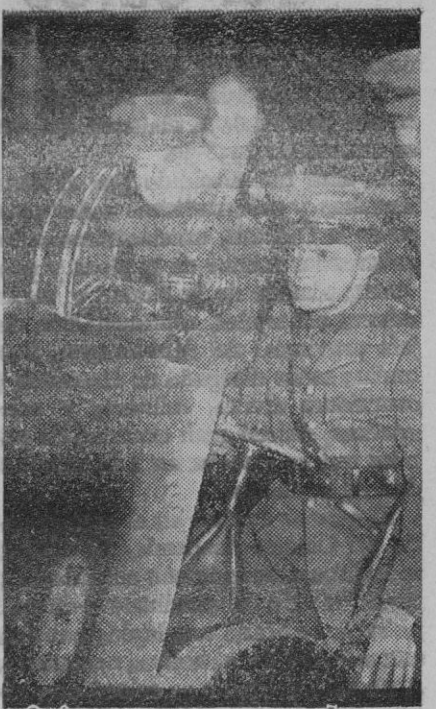
Aquí tenemos a Lord Wuffield, el rey del automóvil. "Filántropo" le denomina la Agencia gráfica porque contribuye a la organización de los servicios de defensa de Inglaterra. Le vemos aquí, a la izquierda, detrás de un cañón antiaéreo en los ejercicios de defensa, pues es coronel honorario de la brigada 52. Lord Wuffield "filántropo" Lord Wuffield es un "mala sangre".

Después dichas personalidades estuvieron en las Hermitas de los Pobres, San Vicente de Paul y organizaciones juveniles de Falange Española Tradicionalista, entregándolas las cantidades acordadas.—Logos.