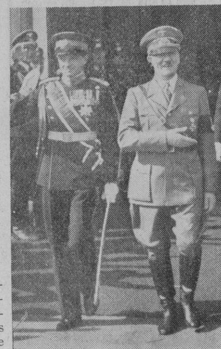
Hitler y el Príncipe Pablo, fotografiados durante la estancia de este último en Berlín

Se relaciona con la situación en Palestina