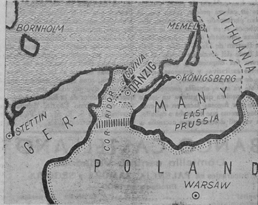
DANTZIG Y EL CORREDOR POLACO.—El trazo de la carretera y del ferrocarril para cuya construcción solicitan permiso los alemanes al objeto de poner en comunicación el Reich con la Prusia Oriental, está señalada con líneas verticales

Berlín, 16.—El embajador polaco Lipski ha regresado hoy de su país. Inmediatamente ha reanudado sus actividades. Se espera que sea recibido próximamente por von Ribbentrop.