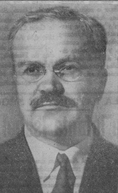
Molotov, el sucesor de Litvinoff en el comisariado de Negocios Extranjeros de la Unión Soviética. Todavía no se sabe cuál será la orientación definitiva que imprimirá a la política exterior del Kremlin