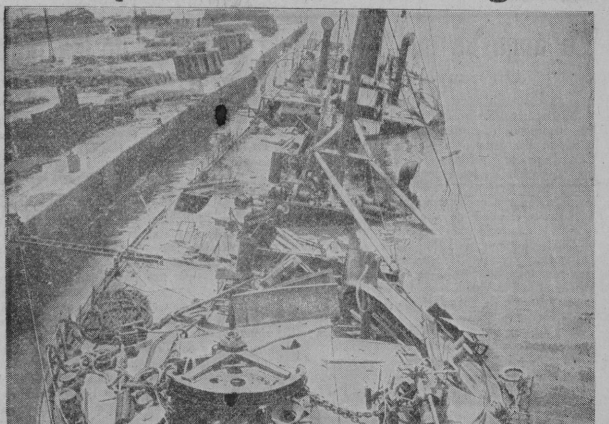
Una vista del puerto de Valencia durante el dominio rojo. Pueden apreciarse perfectamente los efectos de los ataques de la aviación nacional. Pronto el gran puerto mediterráneo quedará libre a la navegación civilizadora, poniéndose fin al tráfico de la piratería

Normalidad absoluta en Valencia. La aviación de este aerodromo ha quedado a disposición de Franco