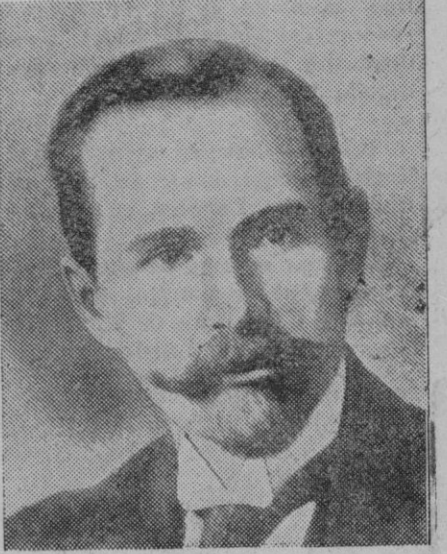
El doctor Antanas Smetana, Presidente de la República lituana, que ha sancionado el acuerdo de su Gobierno de reconocer "de jure" al de la España Nacional

Prieto del Río, a quien se participó que a partir de hoy, el Brasil sostendrá relaciones diplomáticas solamente con la España Nacional.