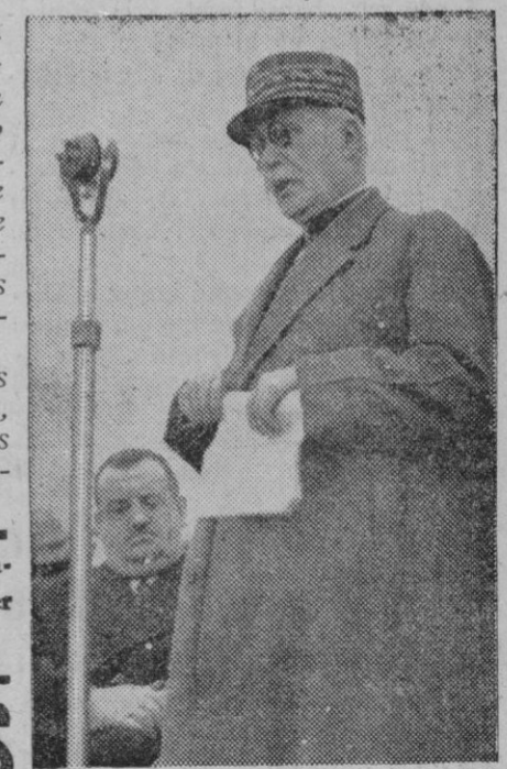
El mariscal Pétain

París, 1.—Algunos miembros de la Comisión parlamentaria de Negocios Extranjeros han manifestado que el anciano mariscal Pétain había manifestado deseos de ser embajador de Francia en España, considerándose probable que la cuestión sea estudiada mañana en el Consejo de ministros que se celebrará en el Palacio del Eliseo bajo la presidencia de M. Lebrun.