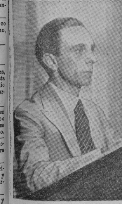
El doctor Goebels

Y proceder, frente a Alemania, como es costumbre entre países civilizados