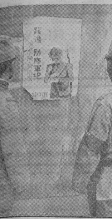
Bajo la guerra en China, el peligro a las grandes epidemias es cada vez mayor. Por consiguiente, la dirección militar japonesa ha colocado carteles para advertir a los soldados el peligro al cólera