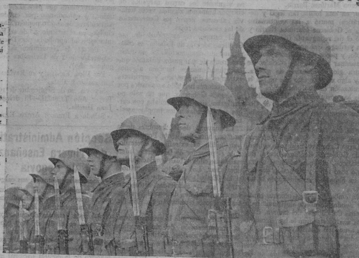
Soldados checos durante una parada militar en Praga

Lector: Si eres combatiente por España, no tires este periódico; dalo a leer a tus compañeros o lécelo tú.