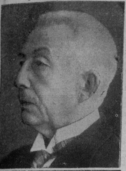
Mr. Colijn, primer ministro de Holanda

La relación oficial entre España y Holanda