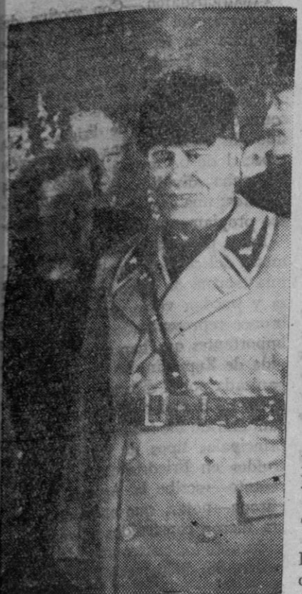
Hoy cumple cincuenta y cinco años Benito Mussolini, Duce del fascismo italiano, y creador del Imperio.

A los votos que en este día hace el pueblo de Italia por su Duce y por su obra, unimos de corazón los nuestros. ¡Viva el Duce! ¡Viva Italia!