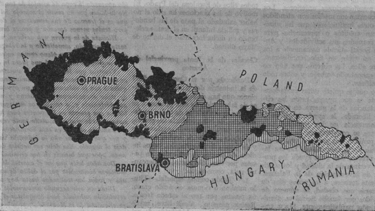
EL MOSAICO CHECO.—Carta explicativa de los diferentes grupos étnicos que integran el actual territorio de Checoslovaquia. Las líneas oblicuas indican el territorio checo; el de los eslovacos está señalado por cuadrados; en negro el de los alemanes sudetes; las líneas verticales indican el territorio de los magiars; las líneas oblicuas, cortadas, el de los rutenos; las líneas horizontales, el de los polacos; y, finalmente, los puntos, la zona en que residen los rumanos. ¡Pobre lord Runcimann!

Praga.—La Cámara será convocada a mediados de Agosto, según informan los círculos parlamentarios. El retraso obedece a la nueva mar-