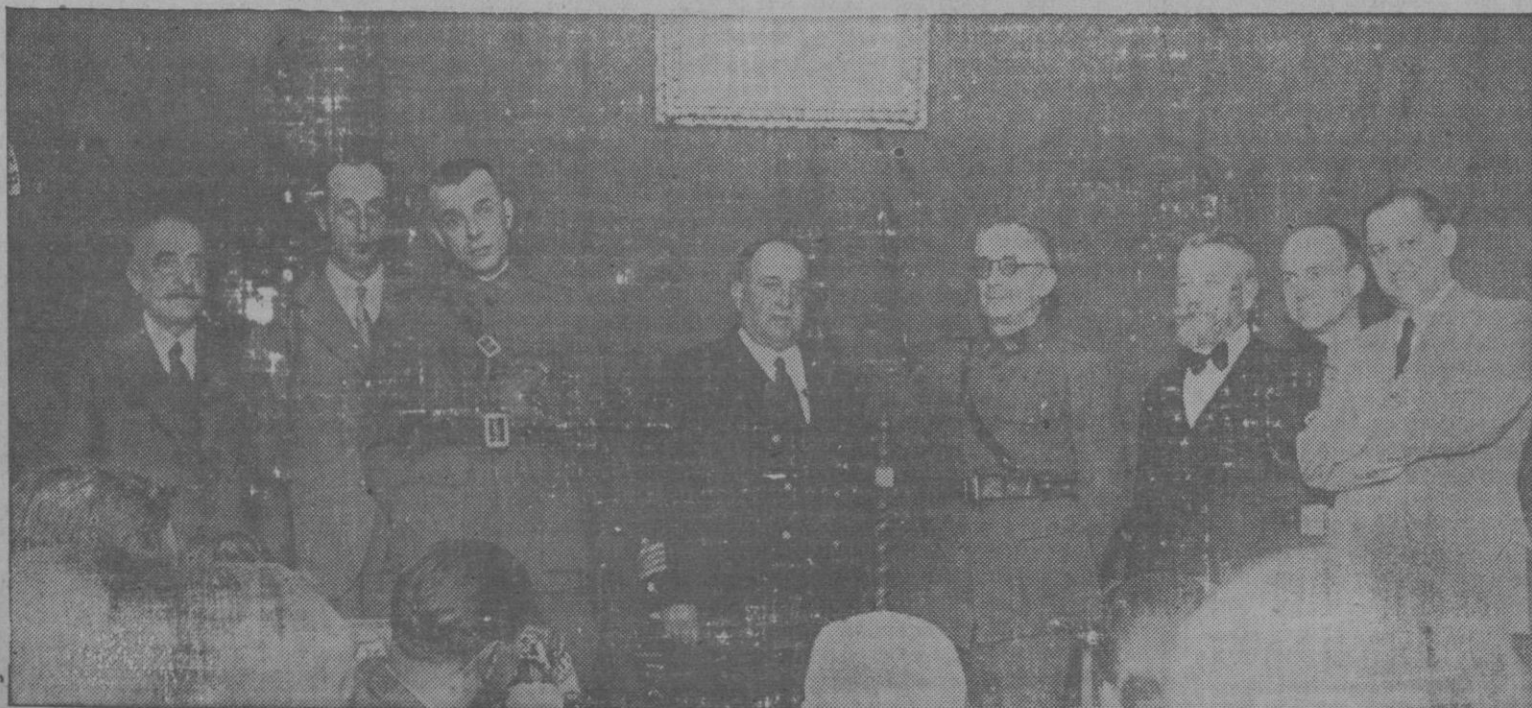
La presidencia, en el acto de la conferencia dada por el Excmo. Sr. Gobernador Civil don Mateo Torres, sobre el tema: ESPAÑA FUTURA