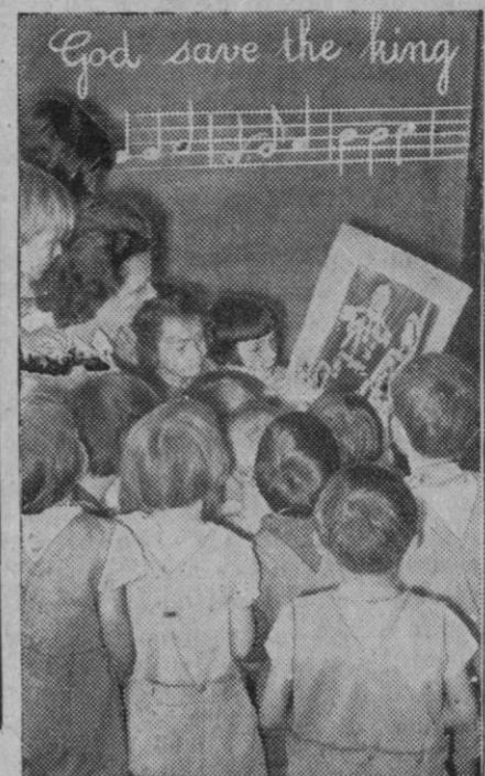
LA VISITA DE LOS REYES INGLESES A FRANCIA.—Con ocasión de la próxima visita de los Soberanos ingleses, los escolares parisienses aprenden el himno inglés que cantarán al paso de la comitiva regia.