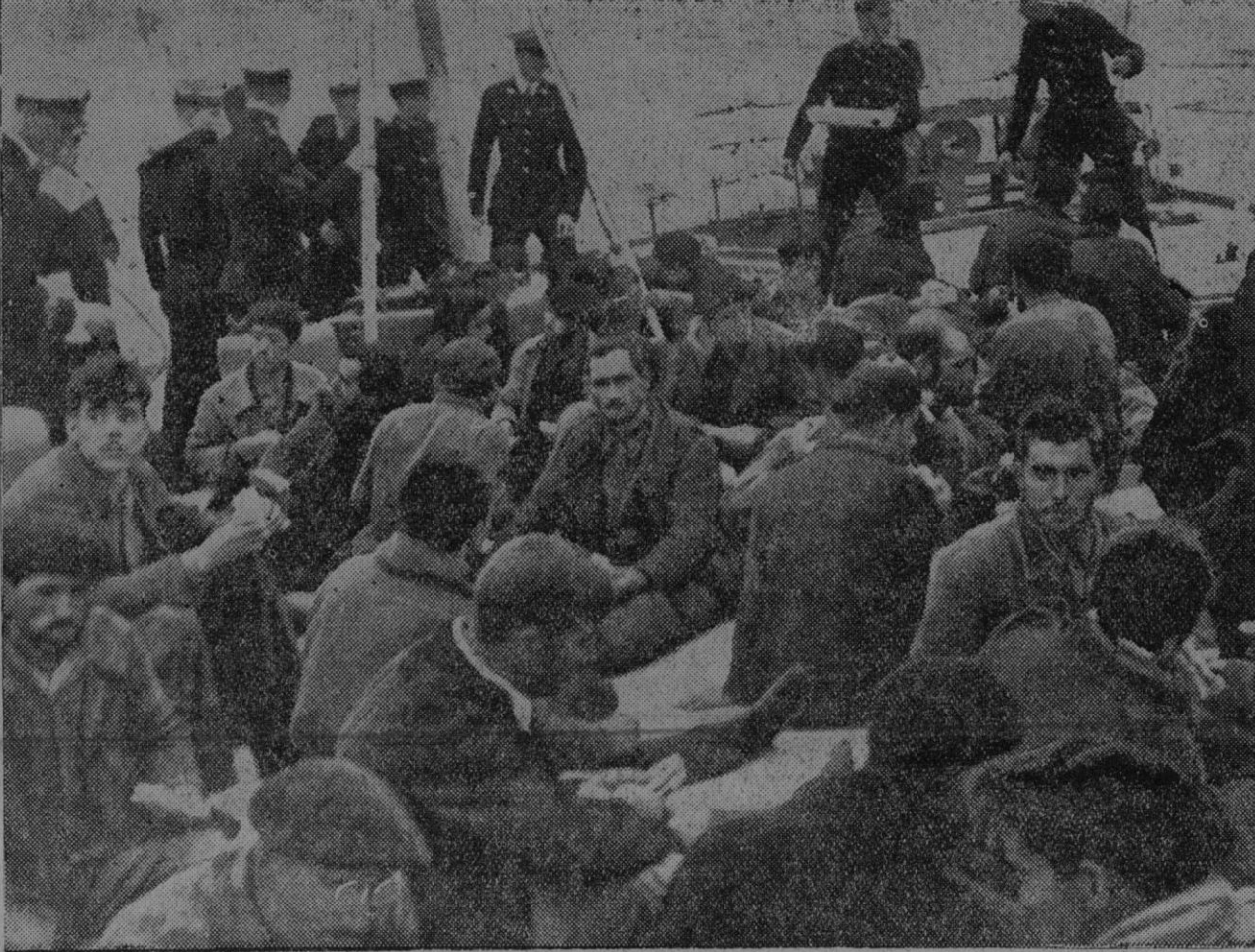
HUYENDO DE LA JUSTICIA NACIONAL.—Desde que las tropas de Franco avanzan por la costa mediterránea, numerosos individuos que tienen cuentas pendientes con la justicia, abandonan las poblaciones cuya caída en poder de los nacionales es inminente. He aquí un grupo de fugitivos por las rutas del mar, recogidos y salvados por un crucero inglés