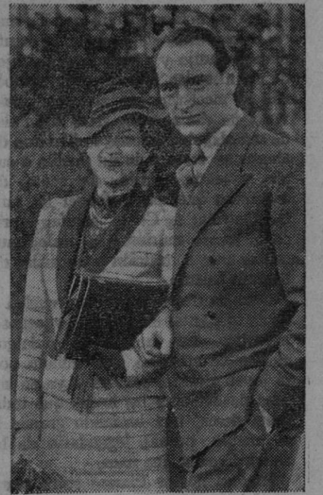
El príncipe Luis Fernando, hijo del ex Kromprinz, en compañía de la duquesa Kyra, que acaban de contraer matrimonio y se dirigen a Doorn, residencia del ex Emperador Guillermo II, abuelo de Luis Fernando

El señor Metaxas terminó su discurso exhortando a la firme unión nacional.