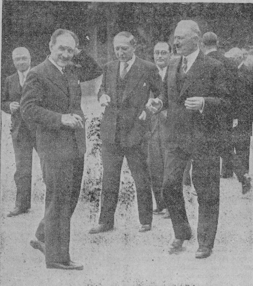
DIFICULTADES FINANCIERAS EN FRANCIA.—El Presidente de la República, Lebrun (a la derecha); el jefe del Gobierno, Chautemps (a la izquierda), y el ministro de Negocios Extranjeros, Delbos (en el centro), después de una conferencia para buscar solución a uno de los muchos y difíciles problemas que tiene planteados la Francia del Frente Popular: el de las finanzas

Por último, he escrito a Cádiz dando un anticipo del programa que se