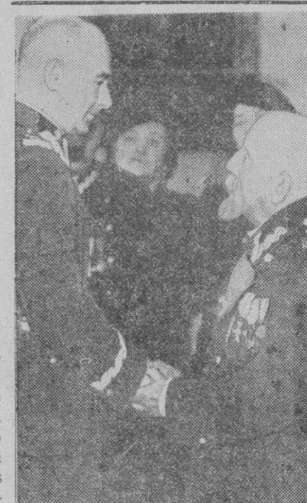
Smigly-Rydz, sucesor de Pilsudski, recibió días pasados a los veteranos polacos de la rebelión contra Rusia en el año 1863. Aquí se le ve conversando con uno de ellos

a esos Gobiernos, más que escuchar la radio de Valencia, oír el paso de los españoles que rescatan valerosamente el territorio invadido por los asiáticos. Pero la oigan o no, será lo mismo, porque España pertenece a los nacionales, porque España no ha permitido jamás la ingerencia extranjera, porque la España que dominó medio mundo se librará muy pronto del puñado de bandidos que ha envenenado al pueblo y ha usurpado sus derechos y su personalidad.