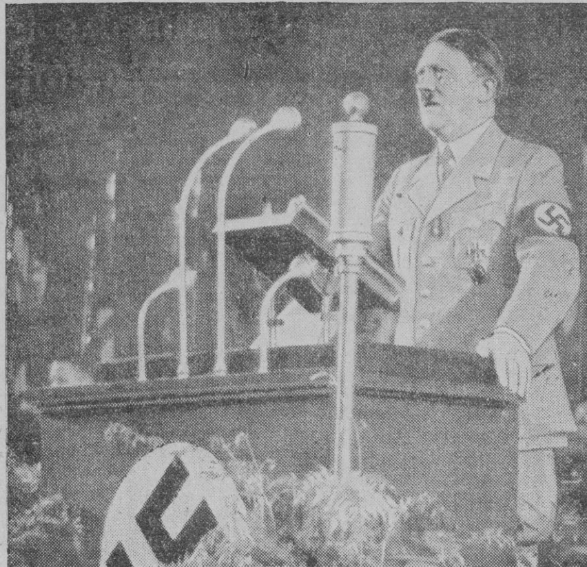
El canciller Adolfo Hitler, arquitecto de la nueva Alemania que se sacude virilmente el yugo del Tratado de Versalles, pronunciará el próximo día 27 otro discurso que, como todos los suyos, es esperado con expectación en el viejo continente.

Cada discurso de Hitler es un punterazo a aquel oprobioso Tratado que asfixiaba al gran pueblo alemán, inutilizándole, no ya para cumplir su misión histórica en el aspecto internacional, sino también para rehacerse interiormente y volver a ser la formidable potencia con la cual era necesario contar en todo cuanto se relacionara con la política europea.