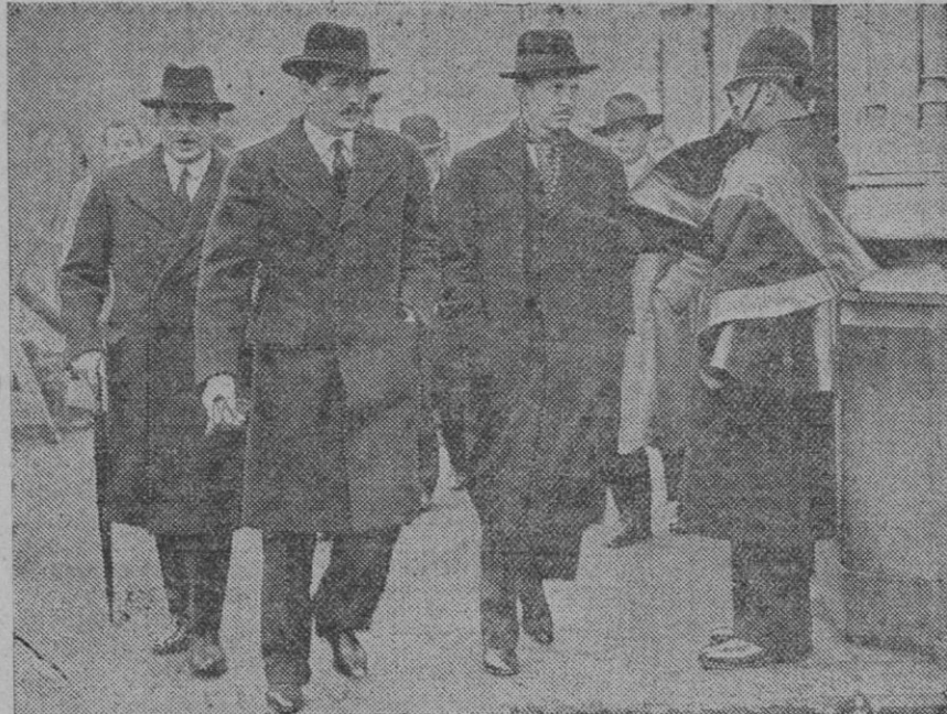
Mister Eden, ministro de Negocios Extranjeros, fotografiado en Westminster con otros compañeros de Gabinete, con motivo de las deliberaciones que se celebran en Londres acerca de la recuperación militar alemana en Renania

Según ha sido informada la United Press, el mariscal Pietro Badoglio ha decidido realizar una ofensiva más, de gran amplitud, antes de la temporada de las lluvias.—United Press.