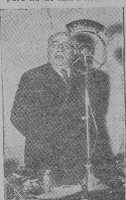
El jefe del Gobierno don Manuel Azaña, que ha hecho importantes declaraciones a un periódico polaco. Aquí aparece pronunciando uno de los discursos que fueron radiados a todo el país.

En cuanto a la Reforma Agraria, tengo el propósito de crear pequeñas granjas que se pudieran tal vez explotar sobre bases colectivas. En Extremadura hay enormes propiedades y los obreros sólo tienen trabajo durante ciertas temporadas cortas. La mayor parte del año no encuentran ocupación.