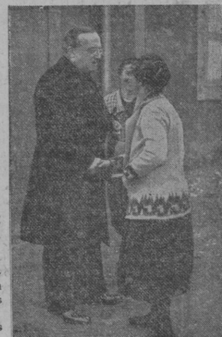
El ex presidente del Gabinete de Francia M. Tardieu, que ha perdido la fe en el parlamentarismo, en el momento de despedirse de uno de sus antiguos electores. Se insiste en que M. Tardieu sustituirá al coronel Larocque en la jefatura de la organización patriótica "Cruces de Fuego"

—Una política de paz dentro del marco de la Sociedad de Naciones.