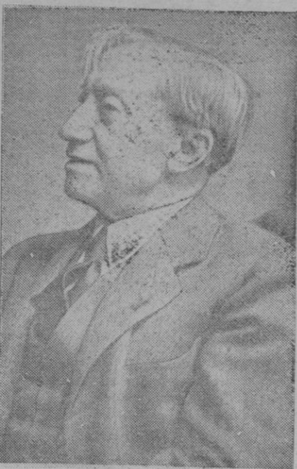
El doctor Federico Cook, de setenta años de edad, descubridor del Polo Norte, que exigió rehabilitación, y, con este fin, ha solicitado ser adoptado como miembro de la famosa sociedad geográfica en América

Porque si se dispersan estas fuerzas, ¿qué queda en la izquierda?