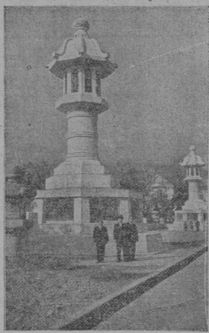
En Tokio han construido estos dos faroles enormes de piedra, probablemente los más grandes del mundo. Ha durado tres años la construcción de estos colosales de piedra

Suma anterior, 748,25 pesetas. Don Cristino Valverde, 5 pesetas; donativos de 0,50, 27. Suma y sigue, 780,25 pesetas.