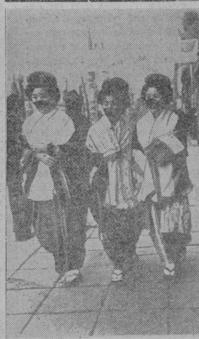
En Tokio las jóvenes llevan en el invierno un pedazo de papel ante la boca, para protegerse contra el frío.

ficios, destrozando cristales y chimeneas. Una casa de las afueras quedó demantelada, resultando milagrosamente ileso sus ocupantes. Los bomberos tuvieron que trabajar en diversas casas inundadas. El río ha crecido metro y medio, habiéndose adoptado todo género de precauciones en los pueblos ribereños.