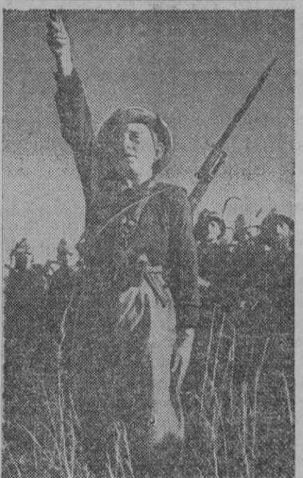
Se ve aquí, durante una misa de campaña en Adigrat, al soldado más joven italiano que ha entrado como voluntario en el Ejército de Africa

Al señor administrador de Loterías número 1 (Segovia), 10.465.