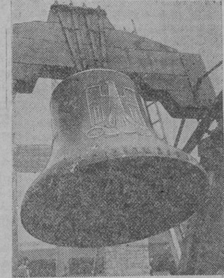
La gran campana que en el año 1936 tocará en la inauguración de los juegos olímpicos. Ha sido terminada en Bochum y ahora será enviada a Berlín. Pesa unos 14.000 kilos.

pea será prevenida a condición de que se establezca entre todas las potencias ginebrinas una franca solidaridad. Todo el mundo desea la conciliación y está dispuesto a ella, pero la Sociedad de Naciones debe exigir contra el agresor el respeto del Pacto, y Mussolini continúa exigiendo el beneficio de la agresión. La Sociedad de Naciones será llamada, seguramente, a estrechar el juego de las sanciones. Si las potencias continúan siendo estrechamente solidarias, este caudillo no provocará en modo alguno una guerra en Europa, pero tampoco procurará la paz inmediata en Abisinia. Mussolini continuará su empresa durante semanas y tal vez durante meses.»—UNITED PRESS.