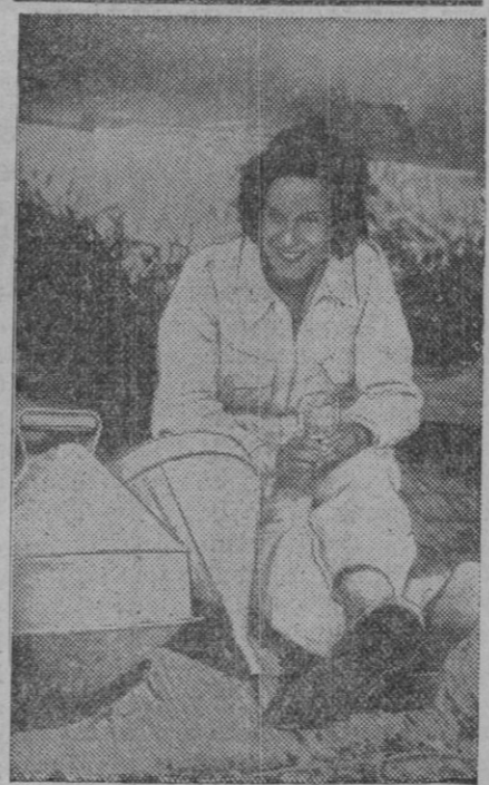
Jean Batten, que batió el record mundial con su avión a través del Atlántico, en unas quince horas. Se la ve aquí cenando por primera vez después de su aterrizaje.

La exposición estará abierta hasta el próximo día 5 del mes de Enero. La entrada será pública todas las mañanas de diez a dos de la tarde y por invitación de tres a cinco de la tarde.