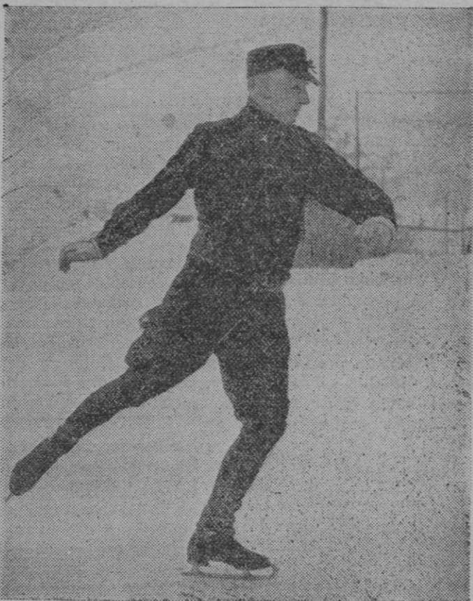
El ministro de Negocios Extranjeros inglés Samuel Hoare que acaba de dimitir, fotografiado en Saint Moritz, cuando se hallaba dedicado al deporte del patin.