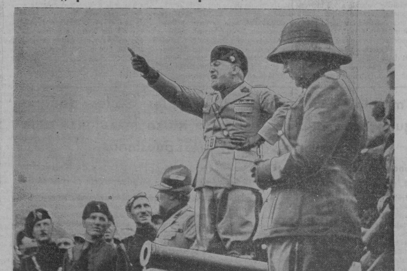
Mussolini, que está concentrando en la frontera de Abisinia 180.000 hombres, arregando a una división de Camisas Negras en Nápoles