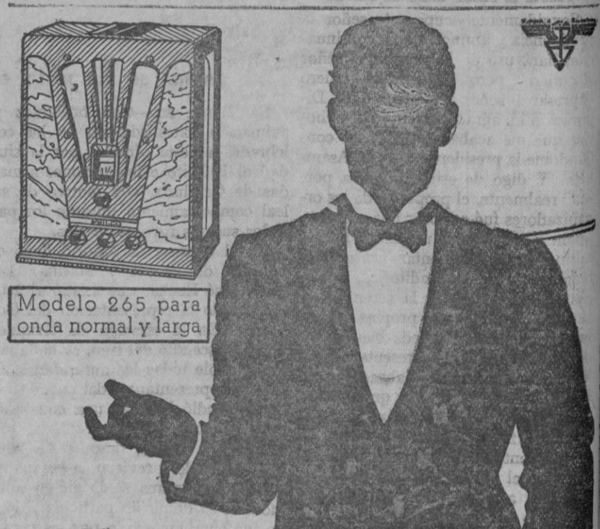
Modelo 265 para onda normal y larga