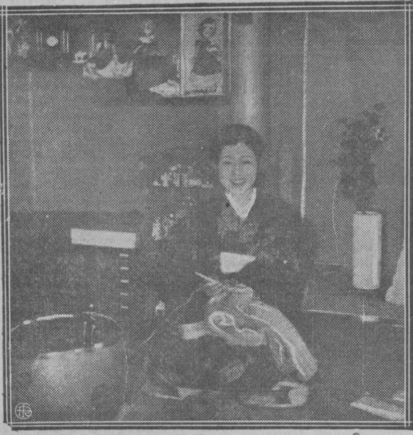
CHIZU KURENAL, una de las actrices más notables de la escena japonesa, que se ha incorporado al cine.

El puerto de Guadarrama abierto a la circulación Ayer, a las cuatro y media de la tarde, llegaron, sin novedad, a Segovia, los automóviles que hacen el servicio de viajeros entre Madrid y esta capital. Esta mañana se ha hecho el mismo servicio normalmente, llegando a Segovia, a la hora de costumbre, los coches que salen de Madrid a las ocho. De la Diputación provincial Una aclaración Por el interventor de la Diputación provincial de Segovia se nos ruega aclaración a una de nuestras notas de la sesión celebrada últimamente por la Comisión gestora de la Diputación en la que se decía que aquel funcionario había pedido que «se le dotara de personal idóneo para cumplir los servicios encomendados a su sección», aclaración que pide en el sentido de que lo solicitado era «personal idóneo para los servicios especiales que están encomendados a la Intervención», ya que el personal que está ahora a las órdenes de dicho funcionario cumple admirablemente su misión. Queda hecha la aclaración, aunque es inútil decir que en la nota que publicó EL ADELANTADO no quiso ser