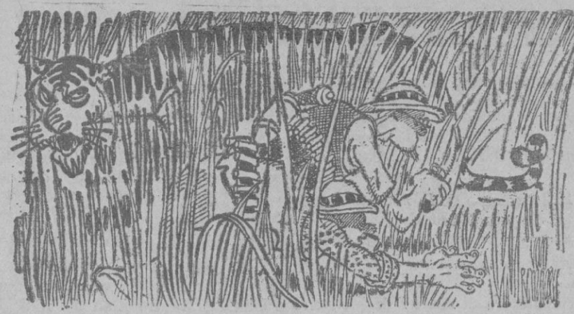
—No te muevas. Es una serpiente. Le voy a cortar la cabeza.