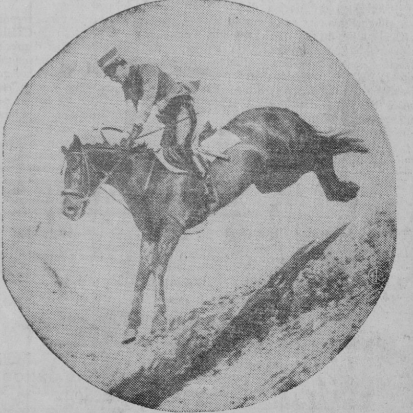
Los corredores saltando el Bachers Brock en la primera vuelta

GRAN PREMIO NACIONAL EN LAS CARRERAS DE DINTREE (LIVERPOOL)