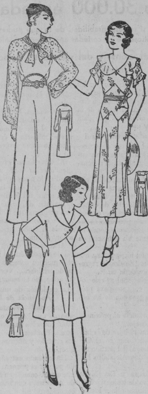
1 Traje mañanero de lanilla marina, con la parte alta de crepón estampado. 2 Vestido de niña, de lana azul «nattie», con cuello de piqué blanco. 3 Traje de crepón estampado, con cuello y puños de organdi.

Cinco minutos más tarde estallo una tercera en un transformador eléctrico próximo al puente de Castañeda. Un gran sector de la ciudad quedó a oscuras. El alumbrado se restableció rápidamente.