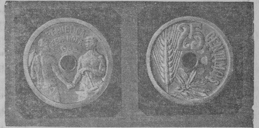
La nueva moneda de veinticinco céntimos de la República.