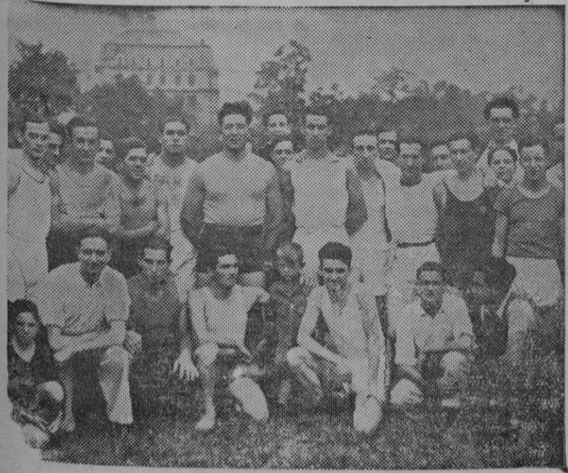
Han empezado ya los campeonatos de Atletismo y pruebas de selección para participar en la popular Olimpiada de Barcelona, por cuyo motivo la jornada del domingo resultó muy movida en los diferentes campos deportivos del País Vasco. Grupo de Atletas que tomaron parte en los campeonatos vizcainos de Atletismo para seleccionar los que deberán ir a Barcelona, en representación del país Vasco.