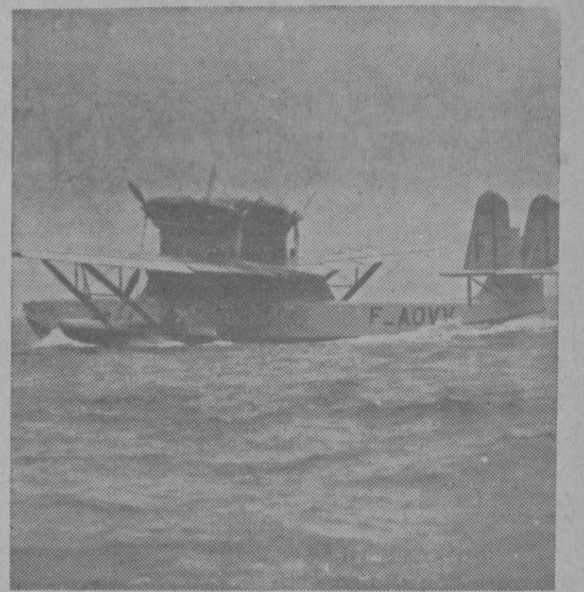
En el muelle de Saint-Nazaire ha realizado pruebas de ensayo el nuevo hidroavión «Loire 102» el cual ha sido destinado para el transporte de pa- sajeros de la línea «Air-France» Atlantique Sud