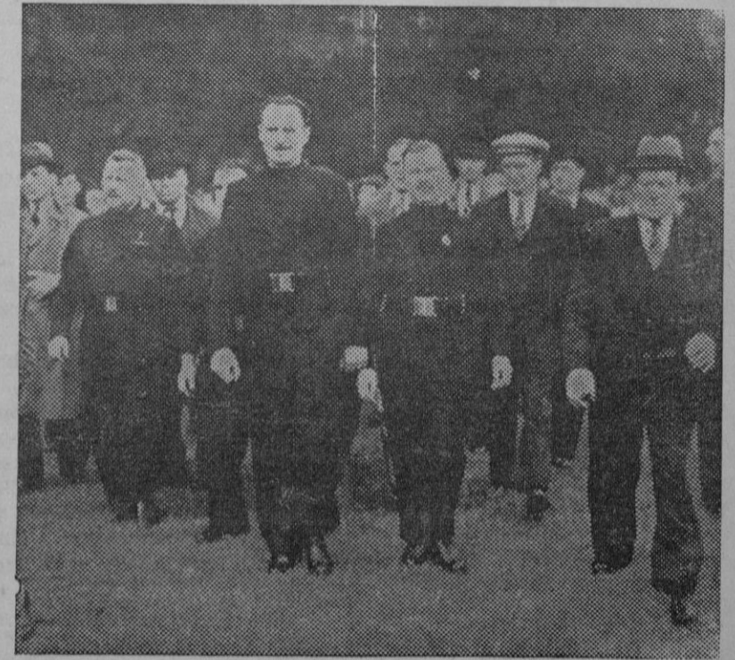
El Jefe del Partido Fascista británico Sir Oswald Mosley con su guardia personal.