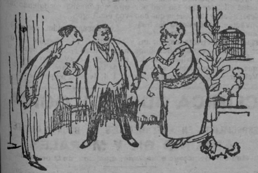
ASOCIACION DE IDEAS

Los maestros de Laguna Rodrigo y Sotillo comunican la apertura de