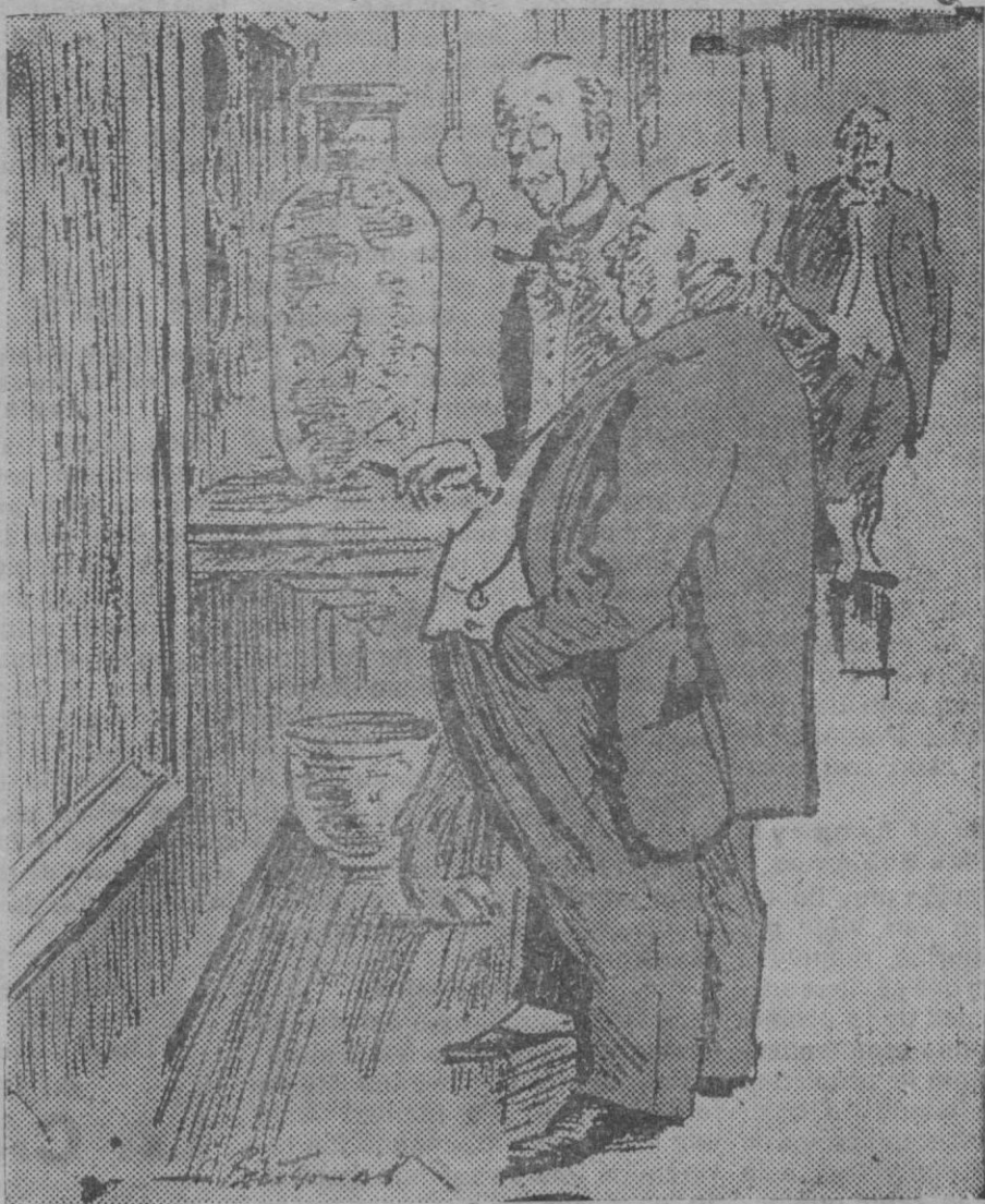
El visitante.—Y ese cuadro que dice usted que ha comprado, ¿es un Velázquez o un Murillo? —Todavía no lo sé. Ahora miraré la factura.

Plaza de Santa Eulalia, núm 10 CONSULTA: DE ONCE A UNA Y DE TRES A CINCO Gratis a pobres en la Casa de Socorro los miércoles y viernes, de nueve a once.