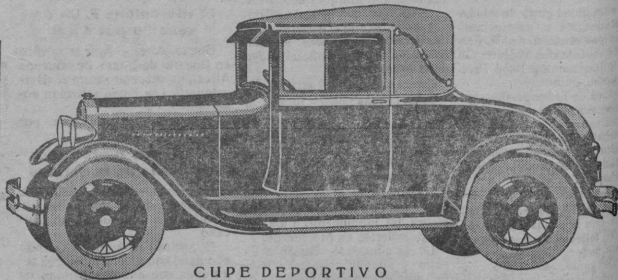
CUPE DEPORTIVO Pesetas 6.205

Estos precios comprenden cuatro amortiguadores hidráulicos Houdaille, frenos a las cuatro ruedas, cinco ruedas de alambre completas, limpiaparabrisas eléctrico en los coches cerrados, cuentakilómetros, indicador de gasolina en el tablero, lámpara de tablero, espejo retrovisor, piloto combinado con «Stop», cerradura de seguridad, bomba para engrase a presión, cristal Triplex en el parabrisas y juego completo de herramientas.