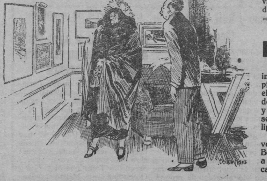
La nueva rica.—¿Y esto, qué es? El vendedor.—Es un cromo, señora. La nueva rica.—¿Es un cromo? ¡Ah, sí!, ahora reconozco su estilo, es un cromo legítimo.