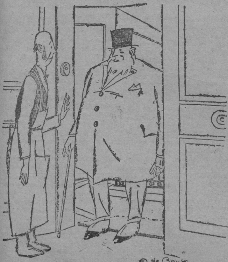
—Soy el doctor que ha sido llamado con urgencia. El criado.—Pues lo siento mucho, caballero, pero el señor está muy grave y no puede recibir a nadie.