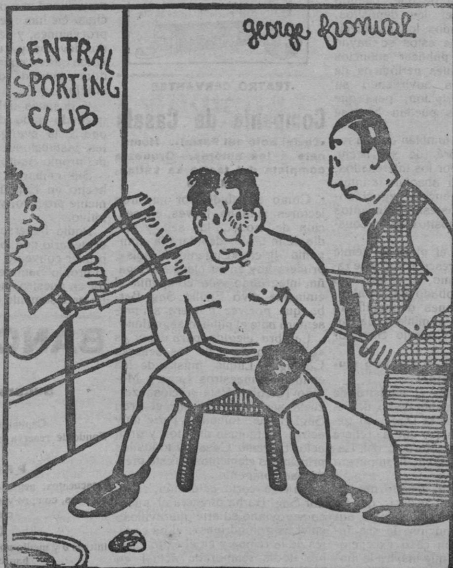
El árbitro.—¿Y por qué le pega tan fuerte a su contrincante? El boxeador.—Es que no le puedo ver. ¿Que no le veo bien, vamos!