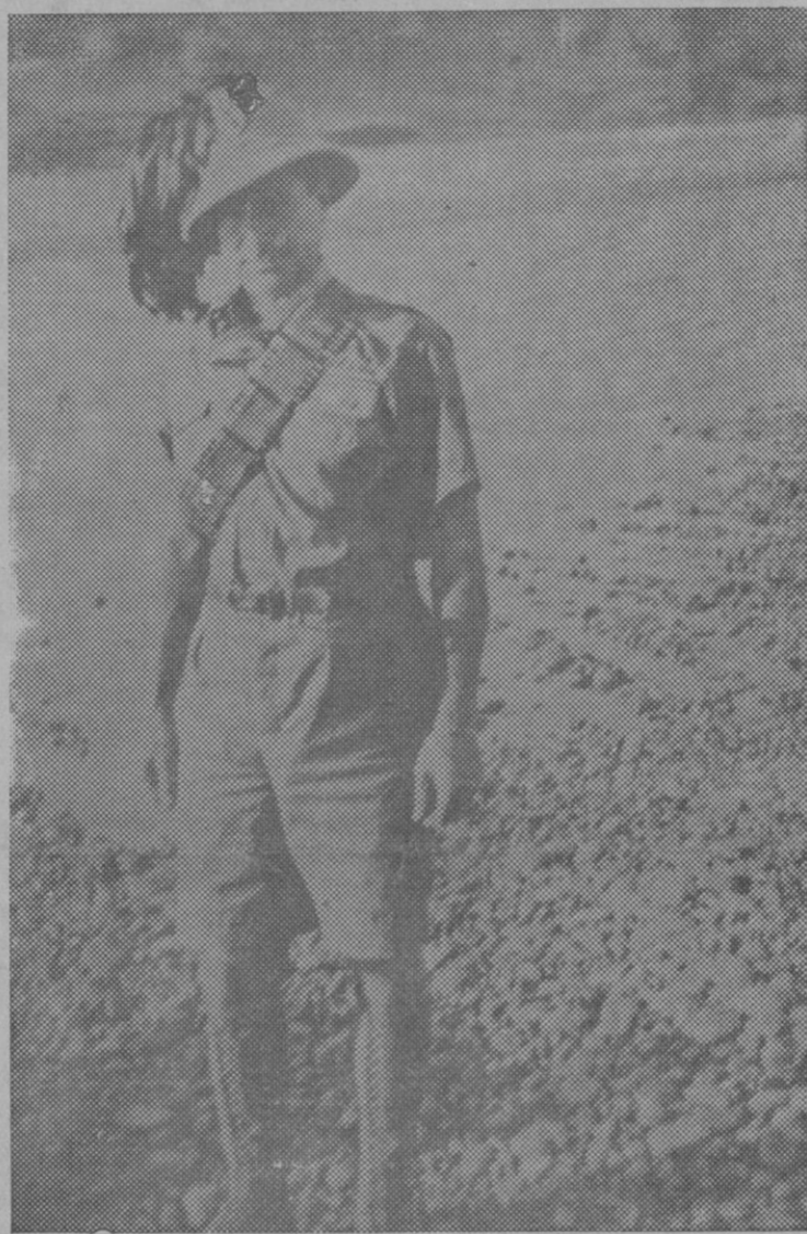
El general Achille Starace el comandante del ejército que ha ocupado Gondar, fotografiado cerca de esta ciudad