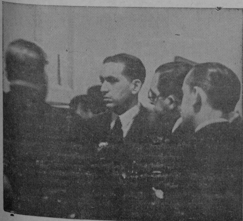
El Sr. Calvo Sotelo conversando con el Sr. Maura en un pasillo del Congreso.