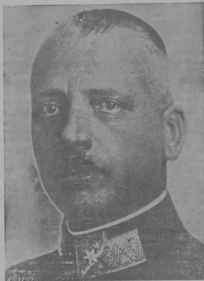
El mariscal Jansa jefe del Estado Mayor de Austria