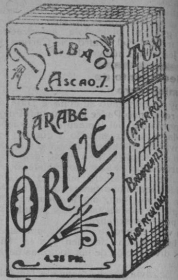
el mejor remedio para el peor catarro JARABE ORIVE Precio. 4.25 pesetas