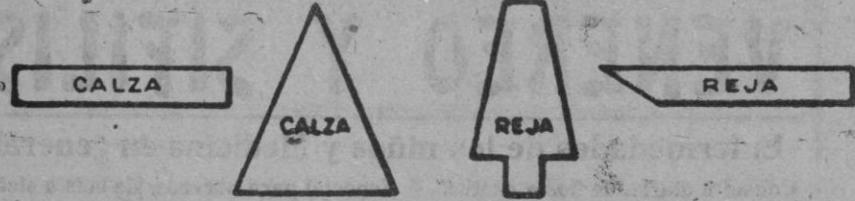
RECORTES Y PLETINAS PARA FABRICACION DE HERRAJES