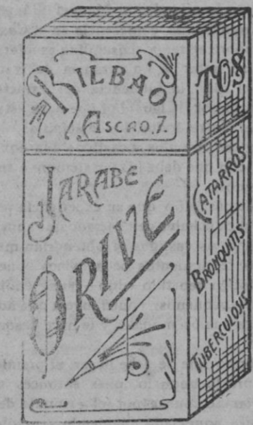
El mejor remedio para el peor carrero, JARABE ORIVE