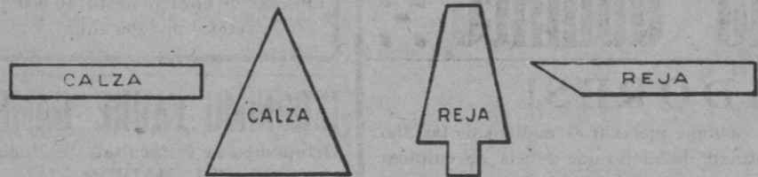
RECORTES Y PLETINAS PARA FABRICACIÓN DE HERRADURAS