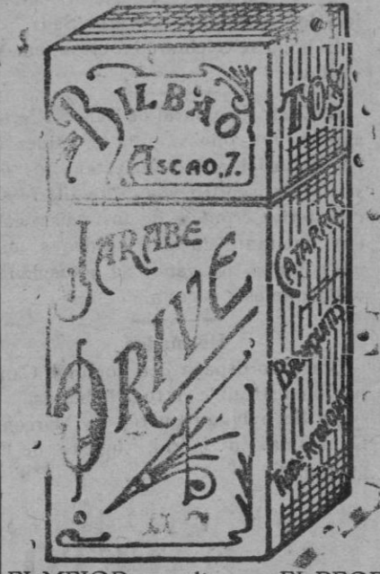
EL MEJOR remedio para EL PEOR catarro, JARABE ORIVE.