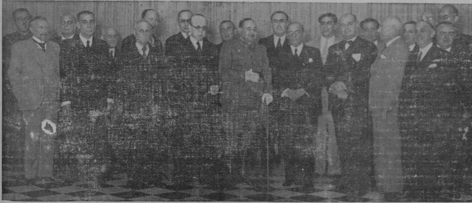
Grupo de autoridades y personalidades que asistieron al acto conmemorativo de la Fiesta de la Raza celebrado en la Diputación.