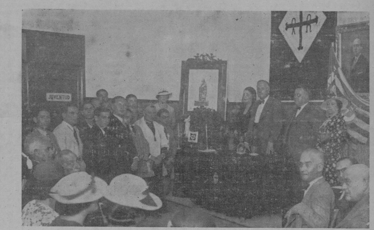
Acto de la entronización de la Virgen del Pilar en el local social de la «Unión de Derechas»

Los habitantes de etiopía se abstienen por completo de comer carne de cerdo, por estar prohibido en el Corán. Aborrecen igualmente la carne de hipopótamo y la de liebre y conejo. En cambio devoran con ver-