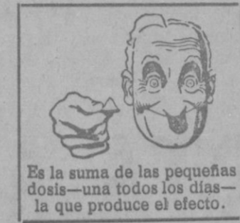
Es la suma de las pequeñas dosis—una todos los días—la que produce el efecto.

envenenan la sangre. Estas sales favorecen, además la secreción de los líquidos que estimulan los órganos de eliminación. Y el potasio también se encuentra en ellas para tonificar y alimentar los tejidos. Sírvase tomar a partir de hoy, y todas las mañanas, una dosis de Sales Kruschen en el café o en el té, o aun disueltas en media copa de agua caliente. Ellas le restituirán la salud, la juventud y la alegría.