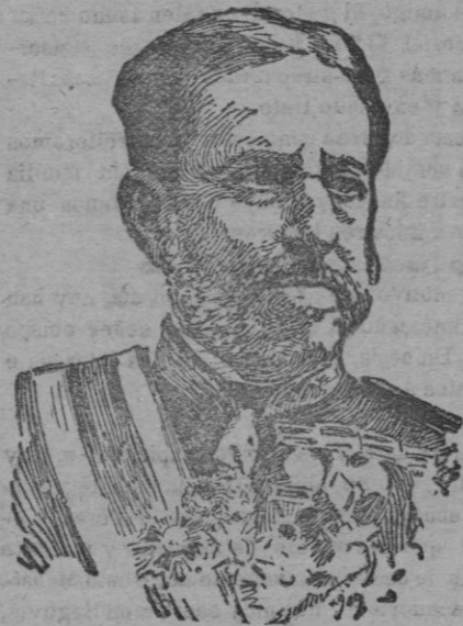
Don Valoriano Weyler

jefe del Estado Mayor Central, que ha presentado la dimisión de su cargo